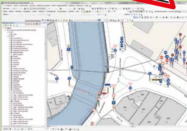
Auszug aus einem GIS-basierten Signalisationskataster