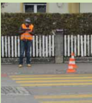
Analyse vor Ort