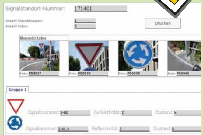
Anwendungsbeispiel aus einem GIS-basierten Signalisationskataster